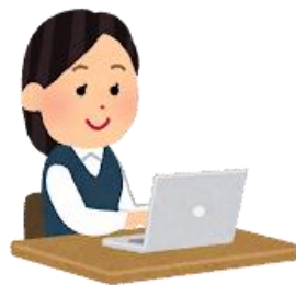
事務局にて 審査・登録処理